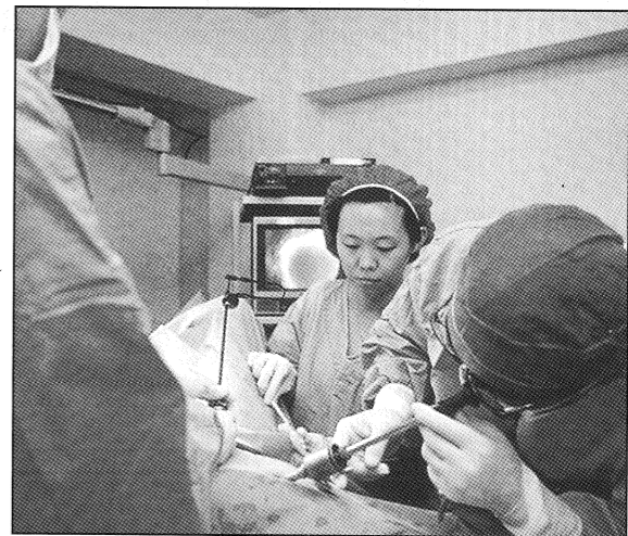
為迎接新生命而努力的醫護人員及母親

然而，除了工作忙碌、風險較大及低健保給付之外，產科醫師還必須面對棘手的醫療糾紛問題。在台灣，除了醫師法，醫療糾紛還涉及刑法，不能完全委託律師來解決。而社會型態的轉變、功利主義的盛行，無形中提高了對醫生們的要求。但對產科醫師而言，許多手術中的突發狀