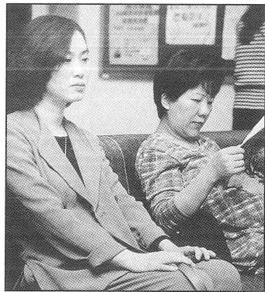
待診中形形色色的婦女

無可避免地，醫療糾紛也常發生在婦科工作上，加上現今台灣在解決醫療糾紛的法規制度上仍缺乏，常常誘發一些畸形變相的抗議行為（如：到醫院門口撒冥紙、拉白布條）產生。