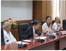
黃校長接待上海中醫藥大學來賓