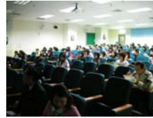
同學認真聽講情形