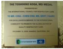
2008 Toshihiko Koga, MD International Medal