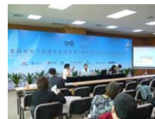
關教授參與由大同大學白老師主持的講座並發表並發表演說