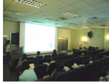
同學發表口頭論文