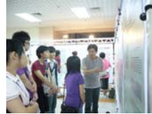
發表壁報論文同學向評審老師解說壁報內容