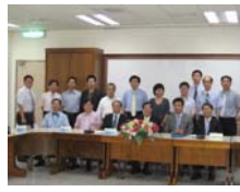
交流座談兩校教師合影