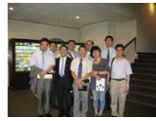
參觀中醫藥展示館