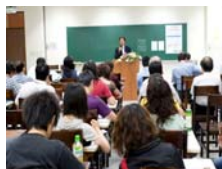
中國醫大舉辦「產學價值創造營」盛況