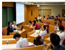
參與「產學價值創造」的師生興緻盎然