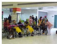
護理之家住民長輩也在場感受歡樂的耶誕氣氛