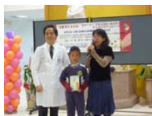
林院長致贈成龍國小一本書"每天給自己一個希望"，希望小朋友多閱讀充實自我，每天都有無窮希望