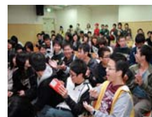
宿舍同學歡樂一堂