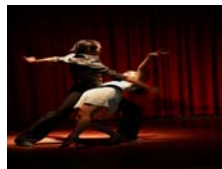
國標舞社精湛演出博得如雷掌聲