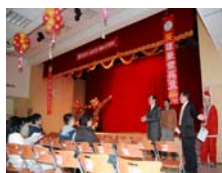
校長親臨會場給予同學嘉勉