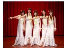
民俗舞蹈社精采的表演