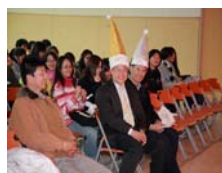
全程參與活動的學務長-造型很可愛呢