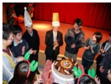
幫壽星慶生~一起切蛋糕啾