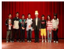
林學務長頒獎鼓勵同學