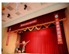
英雄豪傑齊會宿-才女佳人入芳舍