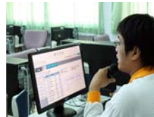
資訊中心謝先生詳盡解說