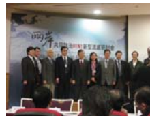
第一場座談會的兩岸專家學者