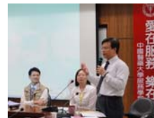
林學務長會後感言分享