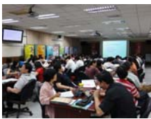
與會來賓參與情況