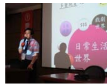
口頭論文發表時間