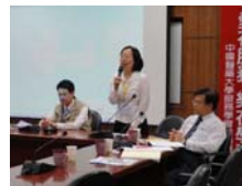
服務學習中心侯主任與會來賓互動