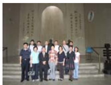
廈門市政府考察團合影