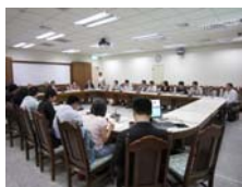
廈門市政府考察團一行14人 與本校教師參與座談會