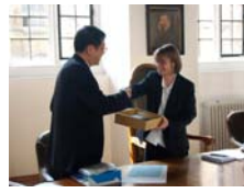
黃校長與劍橋大學Gladden副 校長交換禮物