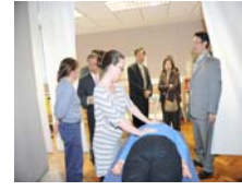
參觀針灸按摩實習課程