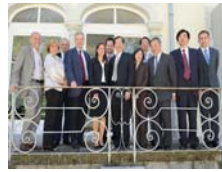
與洛桑大學Arlettaz校長及教 授合攝