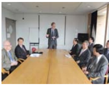
劍橋大學藥理學科 McNaughton主任歡迎訪問團