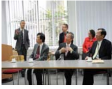
Volker教授報告西敏寺大學 中醫醫院計畫