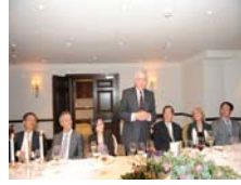
西敏寺大學Hopper董事長歡 迎訪問團