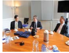
拜會曾來本校訪問之萊頓大 學Beest副校長