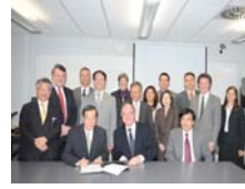
黃校長與Petts校長簽署兩校 合作意願書