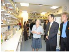
參訪西敏寺大學西方草藥之 調劑