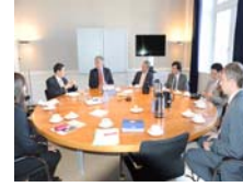
與萊頓大學Heijden校長座談