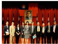
與會專家學者共同合照