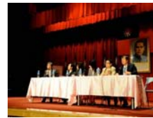
綜合座談時，回應與會者的提問