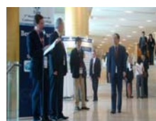
許耕榕醫師赴西臘雅典的世