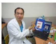
許耕榕醫師投入畢生心血鑽