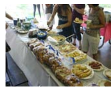
歡迎新進研究生加入的picnic美食分享