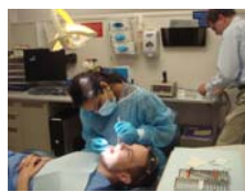
觀摩研究生以 periopaper收集gingiva fluid的臨床實驗 Data