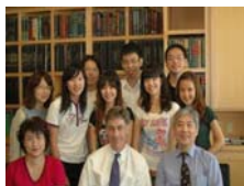
全體同學與OSU Perio Chair合照