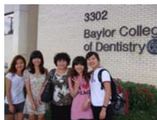
參觀Baylor College of Dentistry, Texas A&M Health Science Center