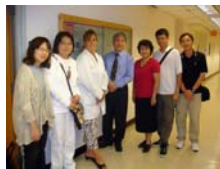
口衛同學與OSU Dental Hygiene Chair合照