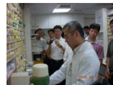
參觀附設醫院中藥局