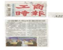
工商時報專業媒體的報導

資料來源： http://www.cmu.edu.tw/news_detail.php?id=1127