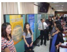
大學首創大規模與績優廠商共同開辦『產學連結創新研發室』貴賓雲集交誼熱絡