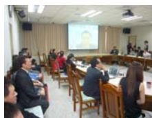
中國醫藥大學研發團隊透過遠距視訊與全省各地廠商做連線