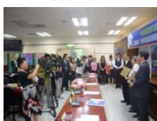
中國醫藥大學與24家績優廠商簽約結盟吸引大批媒體記者採訪生技產業的盛事