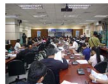
中國醫藥大學與24家績優廠商創新開辦『產學連結創新研發室』簽約貴賓雲集盛況