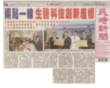
民眾時報以第一版頭條報導 ~ 中國醫藥大學國內首創與 24家績優廠商共同成立『產 學連結創新研發室』簽約盛 況