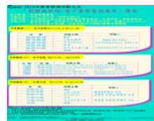
「閱讀無紙境—電子書學習與應用」講座