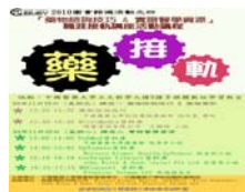
「藥物諮詢技巧 & 實證醫學資源」講座