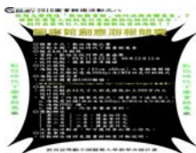
圖書館創意海報競賽