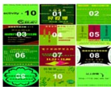
圖書館週十大系列活動