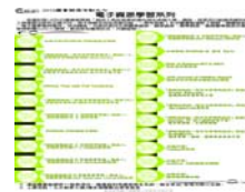
電子資源學習系列