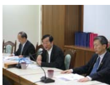
校長主持交流座談