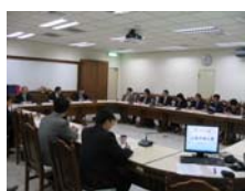
本校教師與來賓熱烈討論