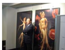
同濟大學斐剛校長於中醫藥展示館留影