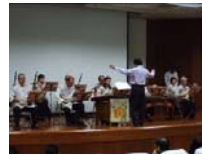
元保宮國樂社表演