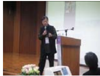
中國醫藥大學後中醫學系講座實況