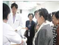
研討會後四國貴賓參訪立夫中醫藥展示館