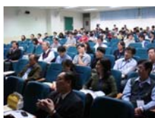
會場實況二：全校師生熱烈參加響應