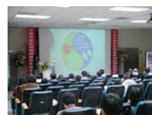
遴選會會場實況一