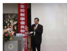
黃榮村村校長親臨致詞勉勵