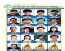
校級教學優良教師候選人