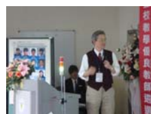
候選人依序進行教學心得報告