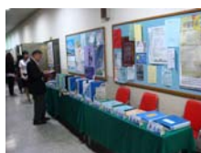
教學資料陳列評分區