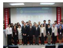
黃校長與校、院級教學優良教師當選人合影留念