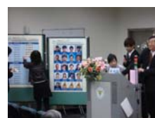
由黃校長抽籤決定教學心得報告順序