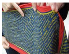
圖3 紀念國際化學年的圍巾有繁體字化學—我們的生活,我們的未來