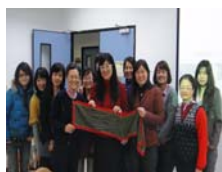
圖2 臺灣參加連線活動的女化學家