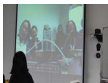
圖6 與新加坡的連線活動