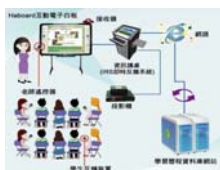
IRS互動性教學系統操作示意圖