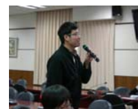
同學針對問題提問