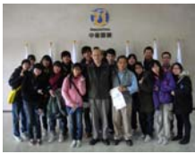
在中龍辦公大樓合影