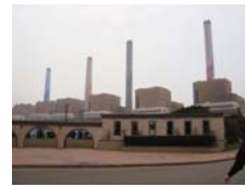
台中火力發電廠全景