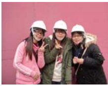
我們在煙囪底下拍照