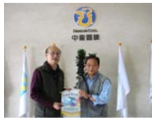
致贈錦旗感謝中龍鋼鐵的解說及導覽