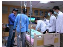
模擬醫學課程訓練實況