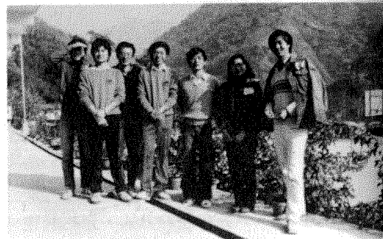
15. 龍山國小口腔保健組員合照。