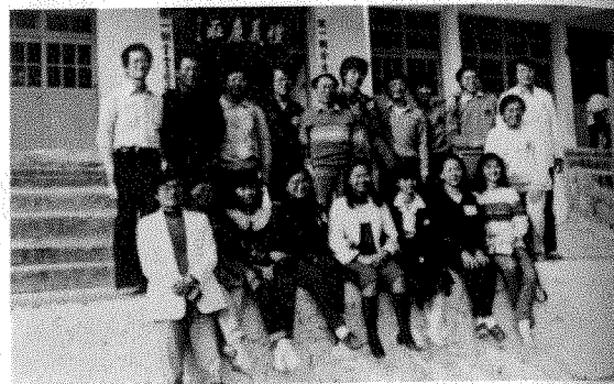
14. 龍山部落之服務人員合照。