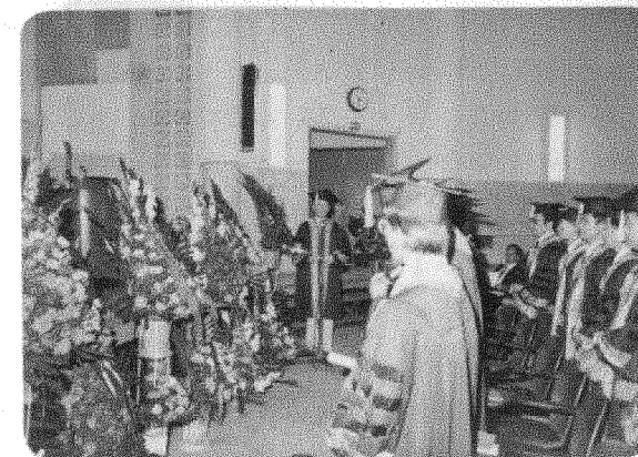
圖三 圖二 圖一 圖四