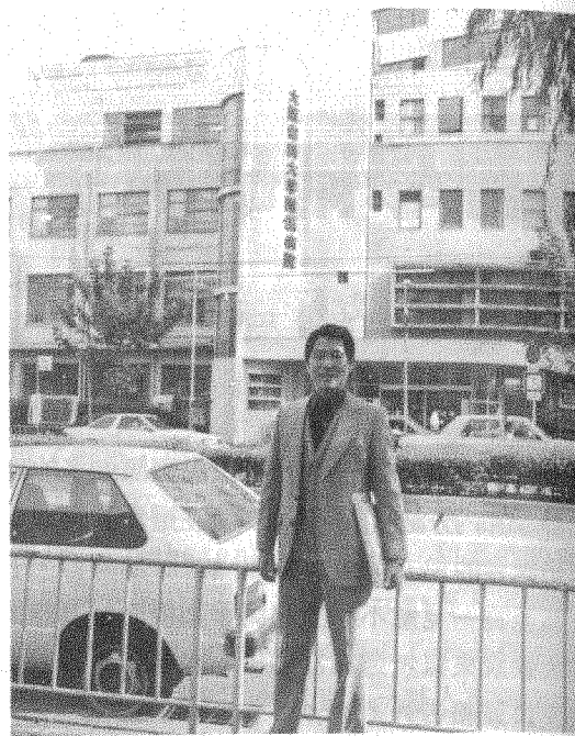
* 大阪齒科大學附屬醫院外貌 *

坐新幹線的“子彈”火車 (bullet train)，以 120 公里的時速離開新潟市車站，經過近四個小時不斷地向前飛跑，最後東京都終於出現在眼前，腳踏在東京火車站裡了。原先約好的朋友賴森洲先生早已在車站裏等我了。東京車站之大實無法想像，上上下下好幾層