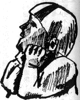
採訪者：黃健雄 陳兩全