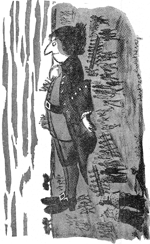
"Probably an overactive pituitary gland."