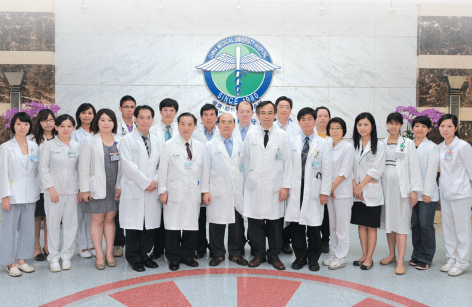
由醫師、衛教師、營養師組成的糖尿病照護團隊

新陳代謝科歷年曾獲5次全國性論文獎，近3年發表論文計32篇，研討會論文計38篇。與中央研究院合作的研究，發現漢人第2型糖尿病的易感基因位於第9染色體protein tyrosine phosphatase receptor type D (PTPRD) 及第17染色體serine racemase (SRR) 基因附近，為全球首次發現。