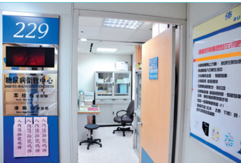
糖尿病衛教中心