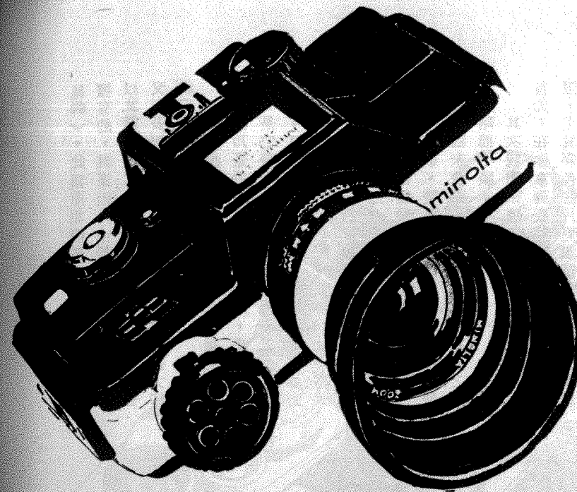
→ 雙眼 135 相機