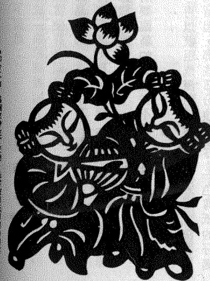
『和合二仙』為廣東帶來了安寧，是常被剪紙引用的圖案。