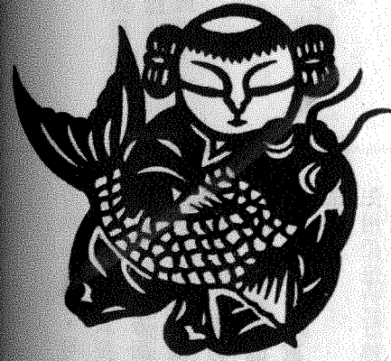
『年年有(魚)餘』是過年時常貼的窗花圖樣。