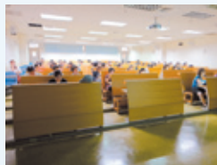
2.同仁們認真聽講及發問