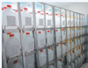
軌道式透析液放置架

改善方法： 運用7-11飲料架的原理，設計了全第一個用於血液透析中心的軌道式透析液放置架，請廠商依原有空間及規格需求量身訂做。有了這個軌道式放置架，貨運廠商將桶裝透析液拆箱平行上架後，打開放置架的固定卡榫，放置架便呈15度傾斜，護理人員依序取用時，內層透析液會自動向前滑行遞補，取用方便。由於紙箱不入庫，環境更整潔，並且可以降低護理人員因搬運透析液造成的背痛、手扭傷等職業傷害。