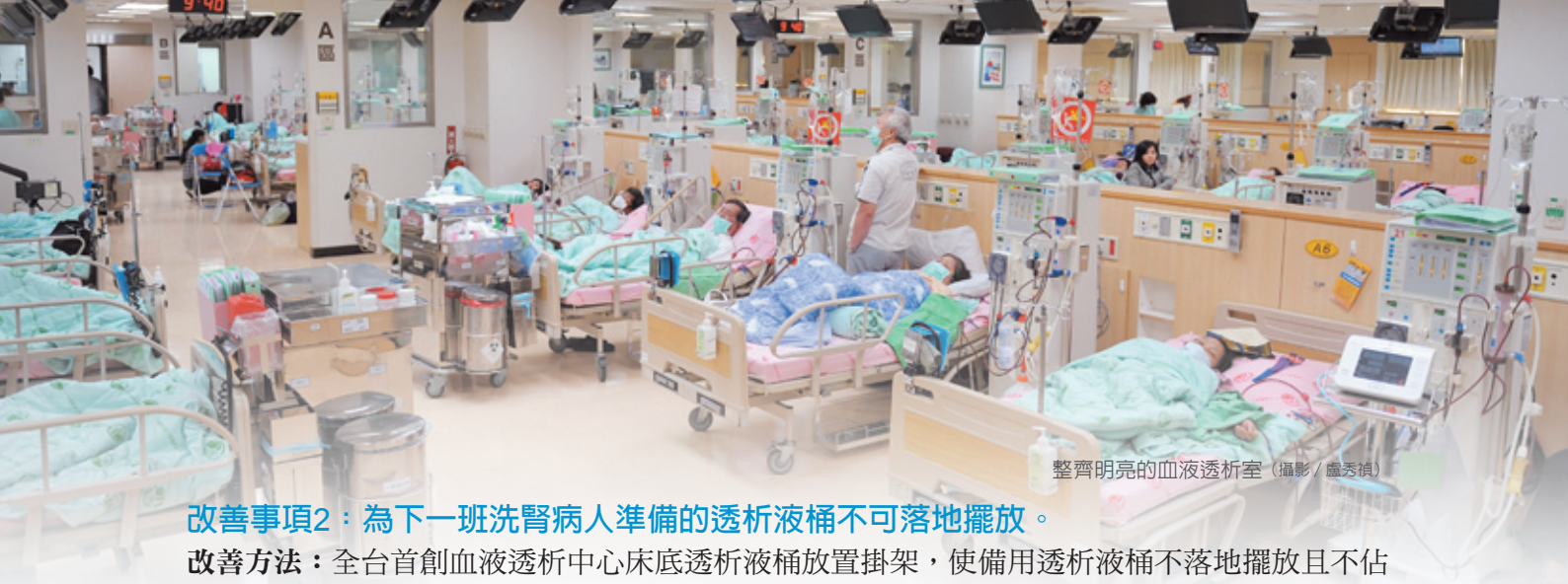
整齊明亮的血液透析室