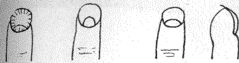
圖3 圖2 圖1

結核病、肺腫瘤、慢性心臟病的人，常是屬於一種「希波克拉底」的標準營養不良型的指甲（圖1~3），指甲面是圓而顯著的凸出及大的月牙（指甲根所出現之半月形白色部位），多數帶著象徵嚴重的血液循環不良的青色指甲。在實質上和形式上指甲都顯得薄弱。這種人常是身體瘦弱而頸部較瘦長的人。