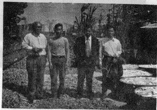
10. 嘉義南庄之山藥加工廠