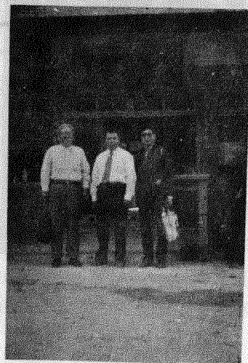
9. 三界村之宏興藥材行