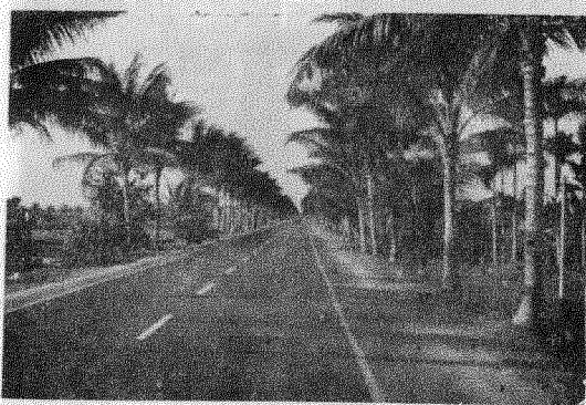
8. 屏東公路兩旁的椰樹