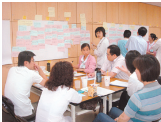
模擬實作