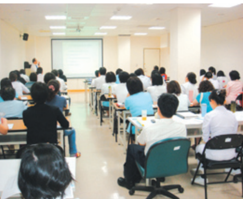
品質工具學習