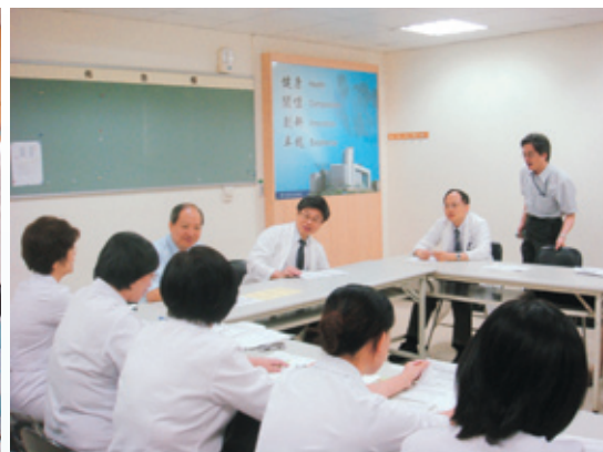
實際應用