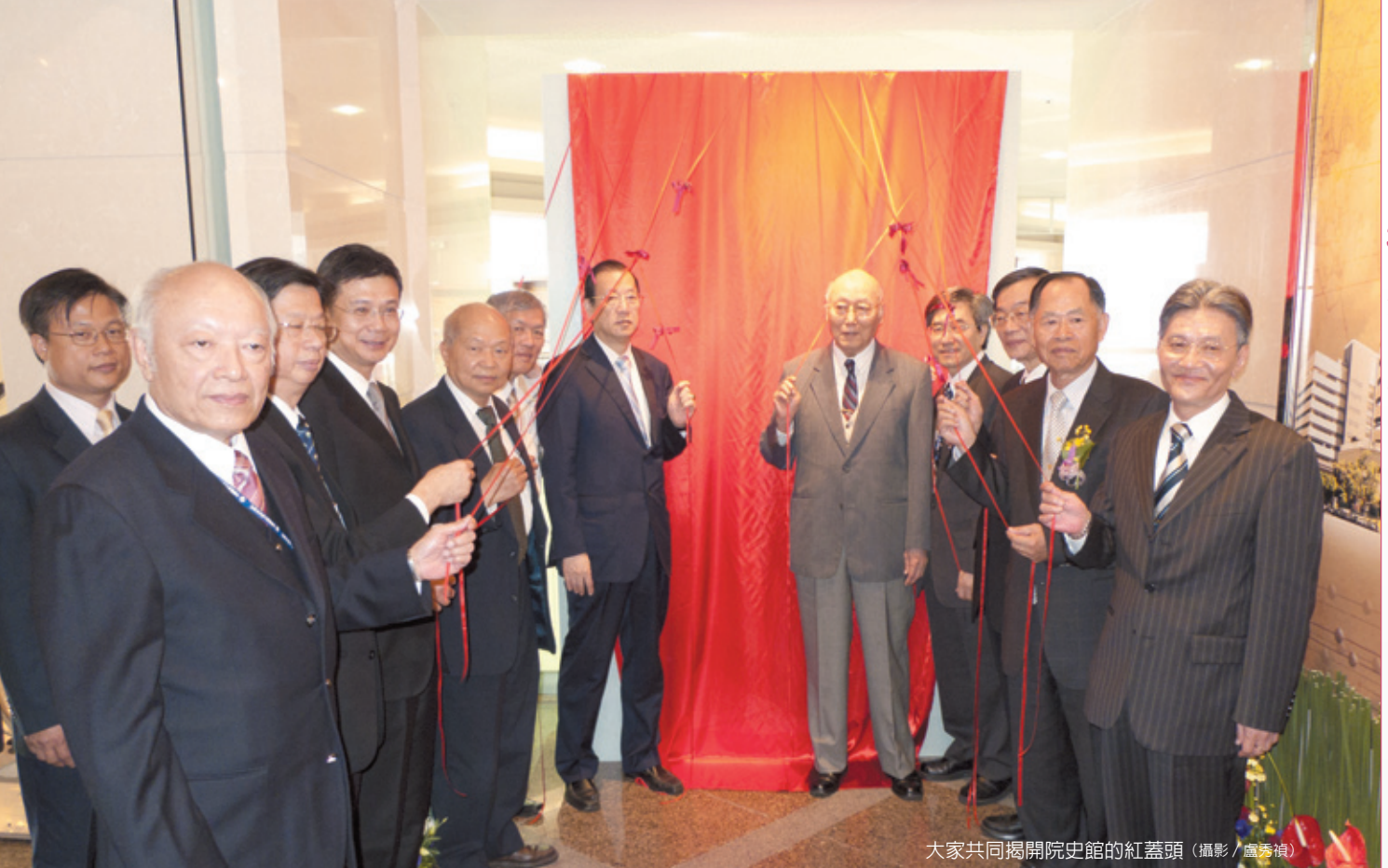
大家共同揭開院史館的紅蓋頭