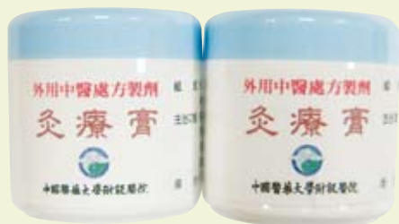
圖一：本院自製灸療膏