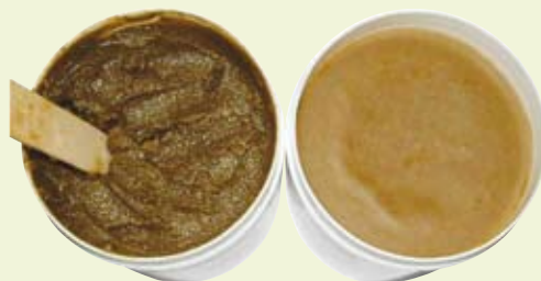
圖二：本院自製灸療膏內容物