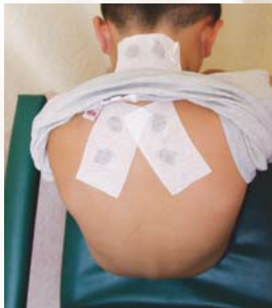
圖四：三伏天灸敷貼穴位（臨床照片）

本法副作用少，作為氣喘與過敏性鼻炎的輔助療法，可以減少疾病發作的次數。根據「內經」春夏養陽的原理，三伏天陽光長、熱度高、是一年四季陽光最旺的季節，人體體表血管擴張，氣血暢通，正宜益氣補陽，此時灸療可扶正培元，儲存能量，有助健康度過寒冬。