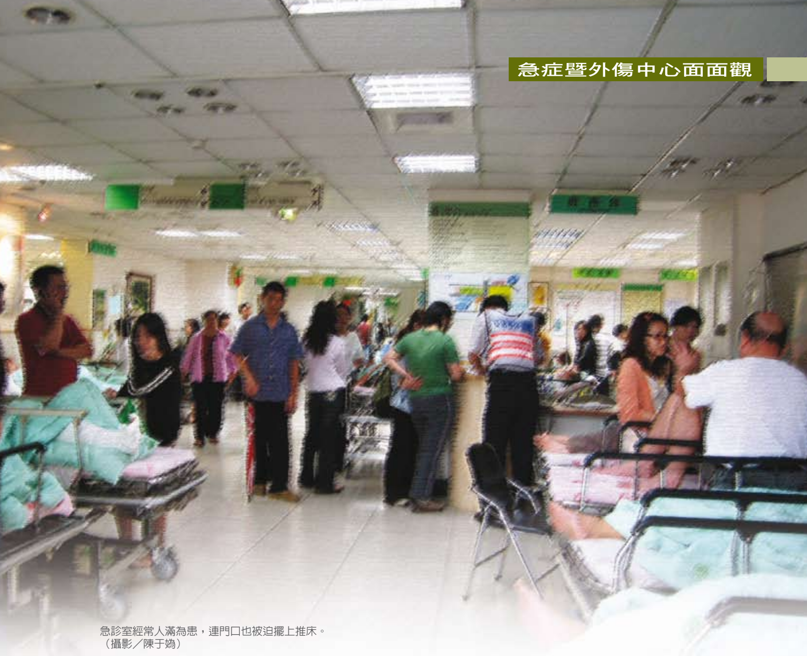
急診室經常人滿為患，連門口也被迫擺上推床。