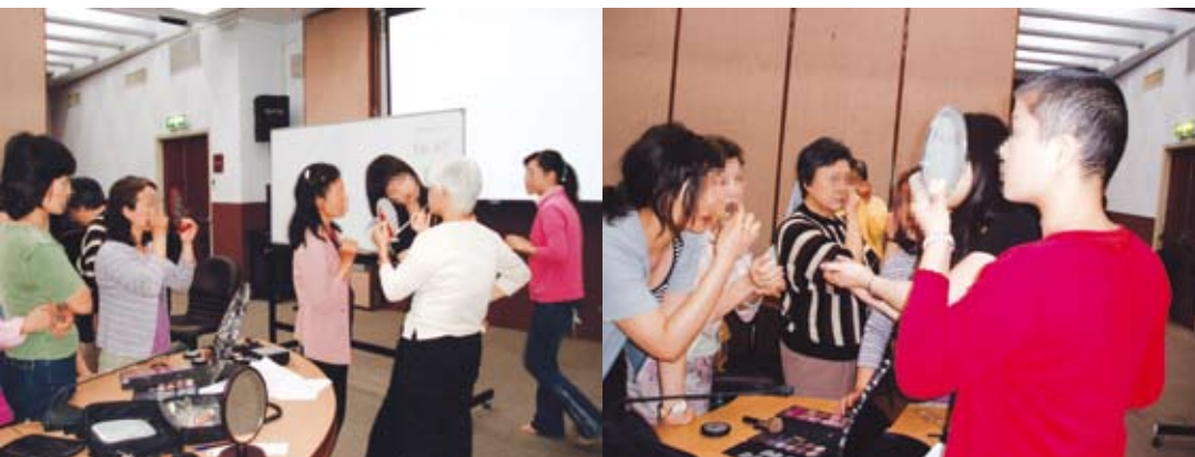
美麗守護班教學實況

「美麗守護班」去年首度舉辦時，由於沒有經驗，病友只是聽老師講，可能因為害羞而不敢在別人面前自行動手化妝。今年就不同了，在老師請示範的模特兒（本身也是病友）上台講解基本彩妝後，不等老師示範結束，大夥兒就已躍躍欲試，迫不及待的想要大顯身手了。