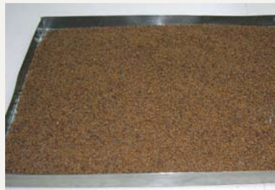
炒過的決明須放涼後再裝袋裝瓶，避免濕氣