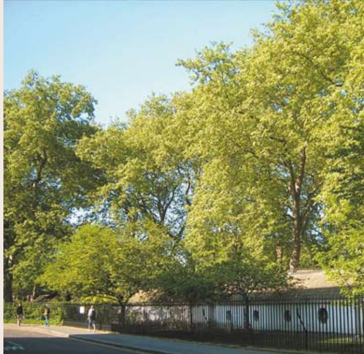
倫敦冬春交接其間，不到3週之內的景致變化（由家中拍攝Coram Field兒童公園外牆）