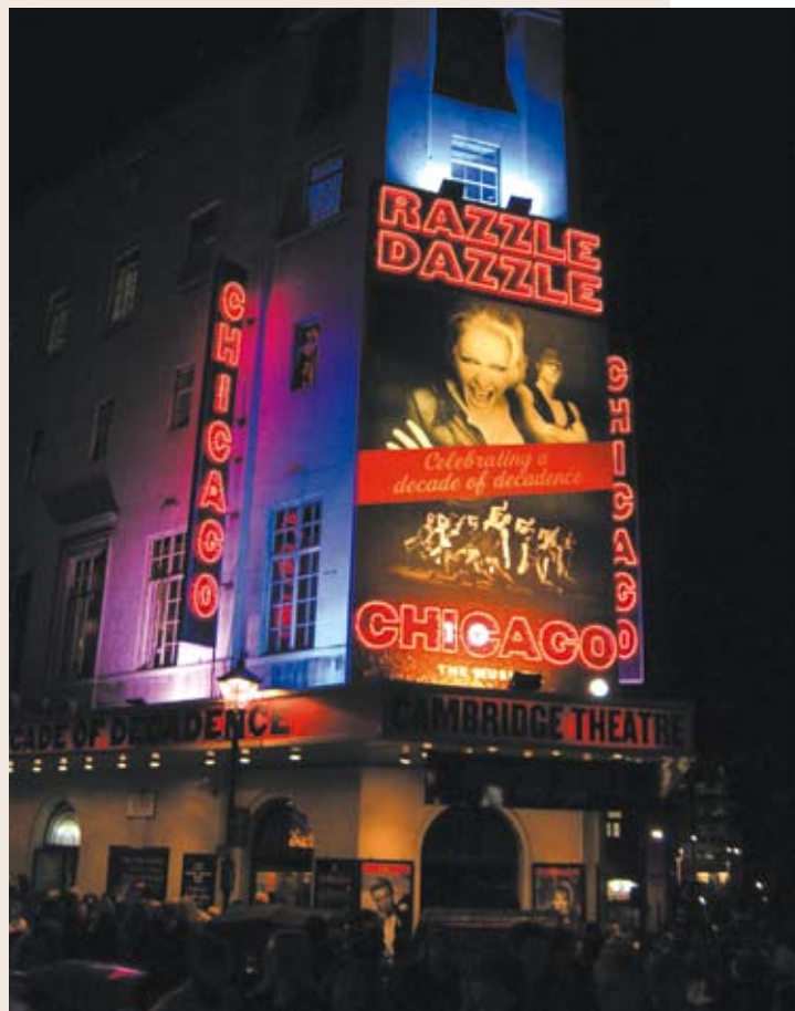
正在上演歌舞劇「芝加哥」的倫敦劍橋劇院