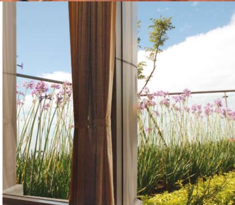
病房專屬花園綠意盎然充滿生機

在日常照護方面，主治醫師們密集追蹤患者病情發展，醫護人員日夜輪值，還有營養師調製適合患者的飲食與進行營養衛教。出院時，家屬不必跑東跑西，在護理站即可完成出院及領藥手