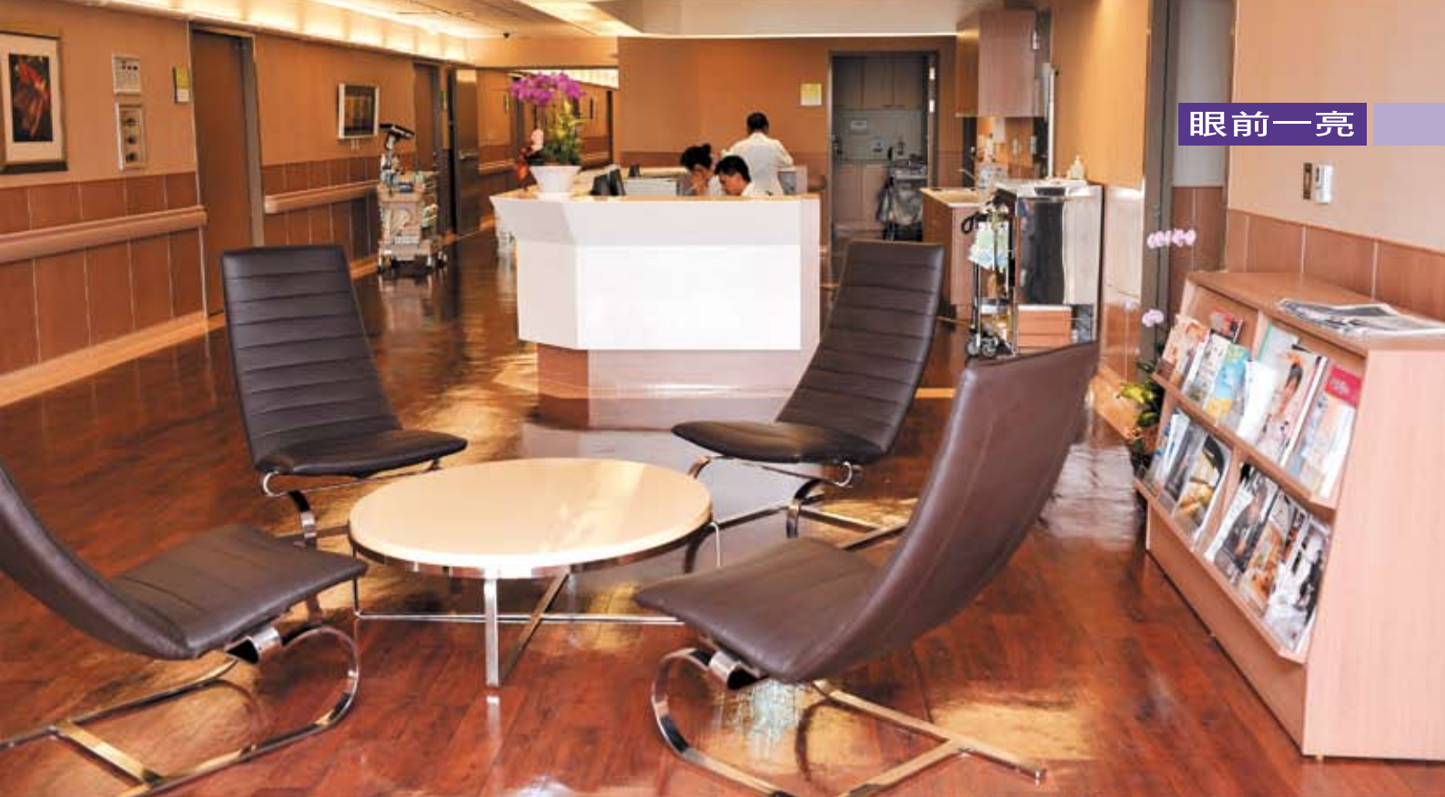
國際醫療病房外明顯不同於一般病房