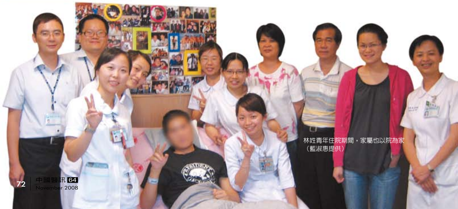
林姓青年住院期間，家屬也以院為家