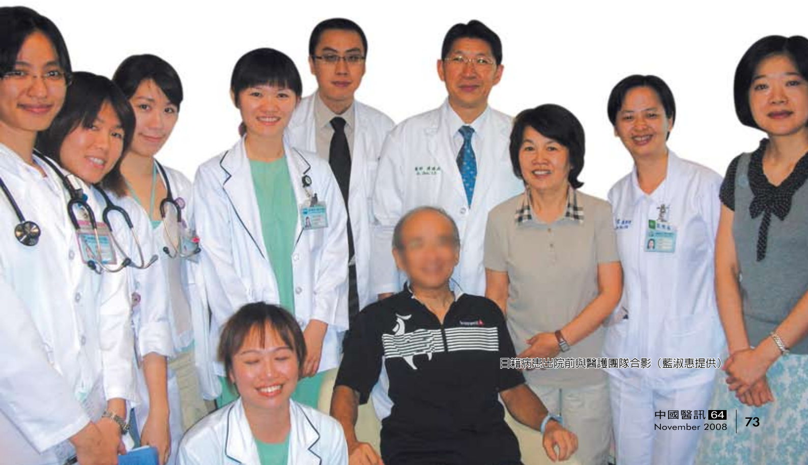
日籍病患出院前與醫護團隊合影